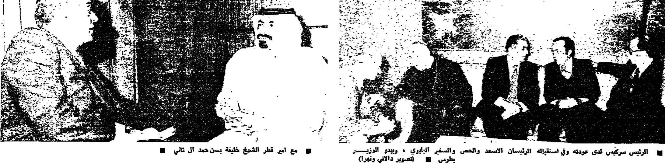
الرئيس سركيس لدى عودته في استقباله الرئيسان الاسعد والحس والسبح البازي وبيدي الوزير بطرس

وأنا أوافقك على كل شيء إلا على أن هذا الذي مررنا به كان - من جملة ما كان - ثورة. قل مع القائلين أنها مؤامرة بشعة. حرب قذرة. أزمة. محنة. كارثة الخ. ولا تذكر الثورة. فالثورات في تاريخ الشعوب شرف من الحرام أن ننسها بما تورغنا به. الثورة؟ أنها آتية لا ريب فيها. كيف؟ متى؟ لا أدري. كل ما أدريه أنها ستأتي على يد هذه الأحزاب الوطنية بالذات. على يد حزب يخرج من خلف المتاريس كما تقول أنت، وينادي إلى انشائه نخبة واعية من هنا وهناك، ويبدؤون من البداية التي كان علينا أن نبدأها منذ الاستقلال بل قبله. كلنا يتذكر الدور العظيم الذي قامت به الكتائب والتحاد سنة ١٩٤٣، وكيف نزل التسلب المسيحي والمسلم إلى الشوارع يواجهون حراس الانتداب منادين باستقلال لبنان. وذاذ يوم كنا نتحدث عن تلك الفترة الحافلة بالحماسة والأمال الكبار. كان ذلك في سهرة عند جميل مكايي أحد منشئي الاتحاد ورئيسها لعدة سنوات، فأخذنا نباري في الأشرطة بالصور المخزور وأن التاريخ لن ينسى للكتائب وللحادثة فضلها. فهز جميل مكايي رحمة الله عليه، رأسه وقال: - بل قولوا معي أن التاريخ لن يغفر لنا جريمتنا: كيف لم نبادر بعد الاستقلال إلى حل المؤسساتين وصهرهما في حزب وطني واحد. بيروت في ٨ آذار ١٩٧٧